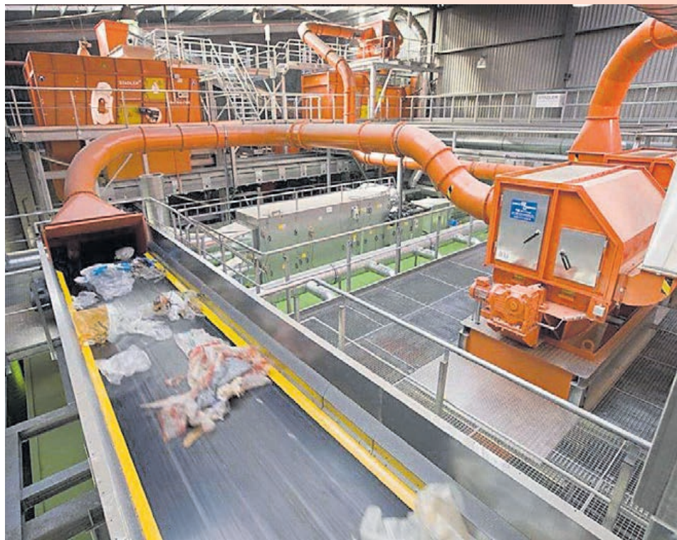
De sorteerinstallatie van SUEZ in Rotterdam.