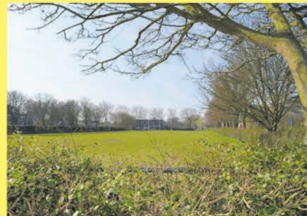
Laatste stuk open groen Oude Dorp