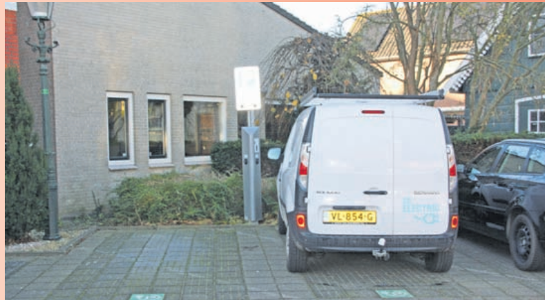
Een auto van het gemeentelijke wijkbeheer staat zijn accu te laden op een van de twee oplaadpunten bij het gemeentehuis. Voor niet-elektrische auto's zijn deze parkeerplaatsen niet bedoeld.