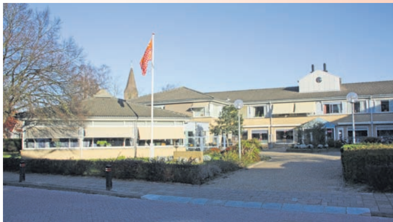
Bij Geesterheem en het tegenovergelegen De Slimp is het afsteken van vuurwerk verboden.

Het college heeft tot deze verboden besloten ter voorkoming van gevaar, schade of overlast. De politie zal optreden tegen overtredingen.