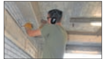
Boven een 'vleermuisplank' wordt een gat in de muur gemaakt als toegang voor de vleermuizen.

Uitgeest - Landschap Noord-Holland heeft vrijdag 26 november in opdracht van Rijkswaterstaat Noord-Holland in een oude zoutbunker een winterverblijf voor vleermuizen ingericht. De bunker bevindt zich onder de A9 bij Uitgeest. De bunker is niet meer in gebruik en staat al enige tijd leeg. Rijkswaterstaat kwam met de vraag of er voor vleermuizen een geschikt winterverblijf van te maken is. Landschap Noord-Holland zag volop kansen en maakte een plan dat inmiddels is uitgevoerd. Er zijn in de bunker ruwe brede planken aan de muren te bevestigen. Tussen de planken en de muren blijft een ruimte open waartussen de vleermuizen kunnen wegkruipen om er te overwinteren. Het was ook nodig een paar invliegopeningen in de buitenmuren te maken, de bunker was anders ontoegankelijk voor de vleermuizen. Landschap Noord-Holland gaat ook onderzoeken of de bunker werkelijk vleermuizen