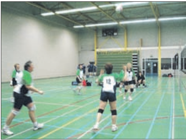
Dames 2 in actie in Sporthal De Lelie te Akersloot.