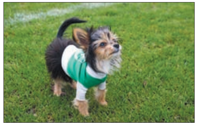
De hond Binkie was ook aanwezig bij het duel van FC Uitgeest. Zijn enthousiasme kende geen grenzen.

Meisjes D2 hebben het zwaar gehad in de voorronde, na de herindeling hebben ze laten zien dat ze wel degelijk kunnen hockeysen. Een spannende wedstrijd tegen Zandvoort, waar ze bij rust voor stonden met 2-0. In de tweede helft werd Zandvoort sterker en kon terugkomen tot 2-1. Er werd geknokt tot de laatste seconde om de winst niet uit handen te geven.