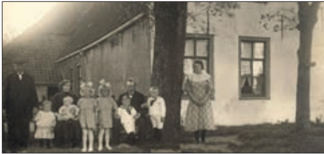
Gezin Terra voor het Kooghuis omstreeks 1920.

somber met de woorden: 'Wat het Kooghuis betreft ziet de toekomst er veel minder rooskleurig uit. In de honderden jaren dat het gebouw in boerenhanden was werd er beter op gepast dan in de afgelopen vijftig jaren dat de overheid het voor het zegen kreeg. Door strenge regels, ellenlange bureaucratische procedures en gebrek aan medewerking, interesse en subsidies is de 17e eeuwse boerderij, sinds 1962 een rijksmonument, anno 2008 tot een armoedige bouwval verworden.'