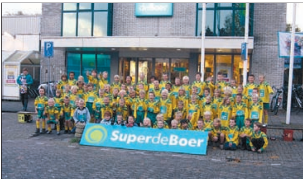
Foto voor nieuwe bedrijfsleider

Nieuwe dames zijn overigens welkom bij de club. De thuiswedstrijden worden zondagochtend om 10.00 uur in Sporthal de Zien gespeeld. De volgende thuiswedstrijd is 23 november in Sporthal de Meet om 10.00 uur. Voor meer informatie: www.bcoranjeboven.250x.com .