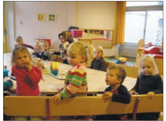
Kinderen van de dagopvang in De Regenboog (De Koog, Benesserlaan 35).