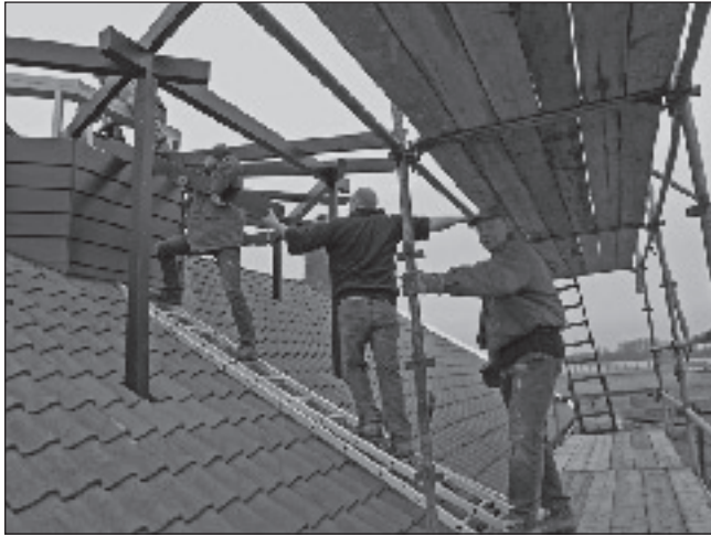
Vrijwilligers van één van de 'klussenploegen' bezig met het opbouwen van een molenstelling.

Uitgeest - Het Industrieel Erfgoedpark 'De Hoop' aan de Lagendijk begint steeds meer vorm te krijgen. Naast timmerwerkplaats 'De Juffer', tevens ingericht als tijdelijk bezoekerscentrum, een droogloods waarop recent een kleine molen is geplaatst, is er een scheepshelling in wording en een restaurant in aanbouw. Een permanent bezoekerscentrum 'Het Pakhuis' zal nog enige tijd op zich laten wachten maar het fundament is gereed. Volgend jaar zal er de herbouw plaatsvinden van een monumentale Zaanse houtloods.