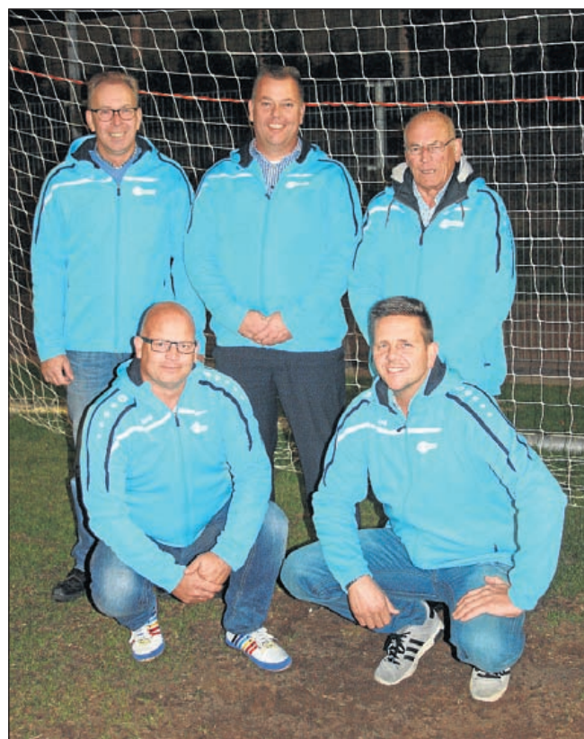
De toernooicommissie heeft er zin in!