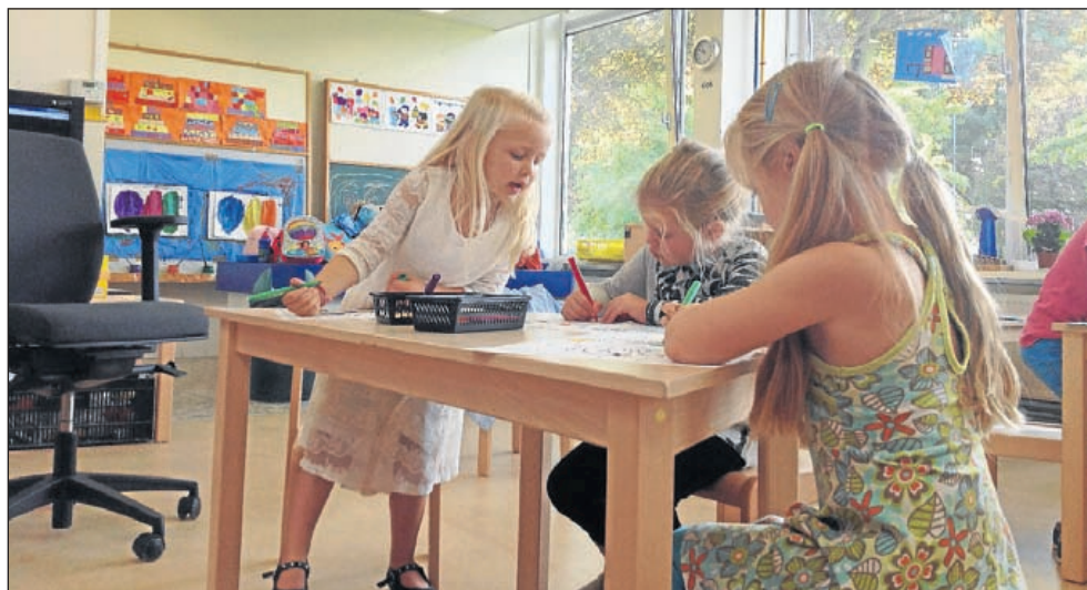
De leerlingen maken iets in het kader van het thema "Feest!"