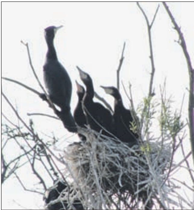
Aalscholvers in een broedkolonie in de duinen.