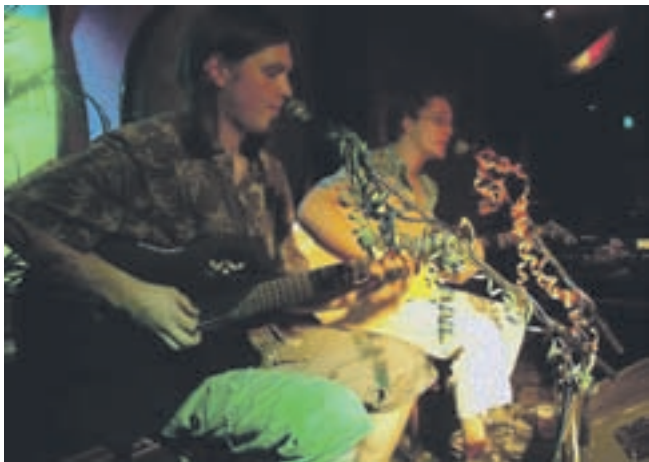
De akoestische reggaeformatie Wisegear.

Belangstellenden kunnen zich opgeven bij de Stichting Welzijn Castricum, tel. 0251-656562, e-mail info@welzijncastricum.nl .