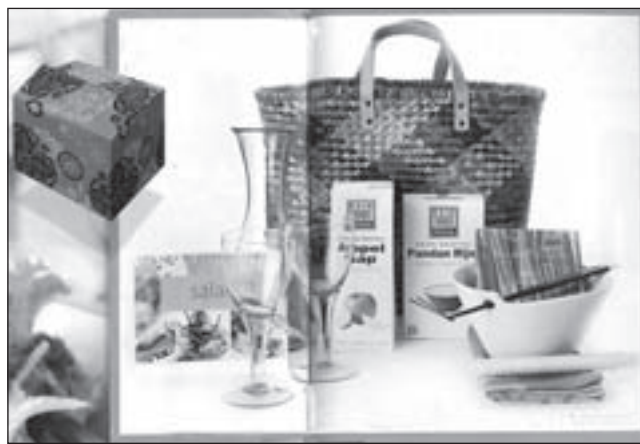
Kerstpakketten in allerlei kleurtinten.

ondersteunt de Gilde-aanbieder mensen belangeloos en betaalt men alleen de onkosten aan de aanbieder, deze bedragen 3,00 euro. Men hoeft verder niets mee te nemen, de aanbieder heeft alle materialen. Belangstellenden kunnen zich telefonisch aanmelden (656562), mailen naar vcc@welzijncastricum.nl of langskomen bij de Stichting Welzijn Castricum in Geesterhage, Geesterduinweg 5. Deze is geopend op maandag tot en met donderdag van 9.00 - 12.30 en van 13.30 - 15.30 uur en vrijdags van 9 - 12.30 uur.