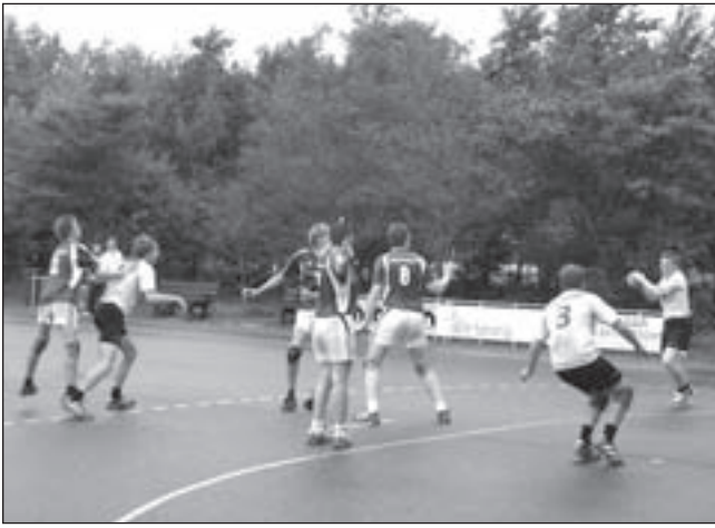
Marco Buur scoort vanuit een prachtig uitgespeelde Meervogels-aanval.