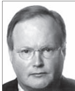
Hans van Baalen

Manders en Van Baalen zijn kandidaat voor het lijsttrekkerschap voor de verkiezingen van het Europees Parlement. Deze worden gehouden op 4 juni 2009. Het