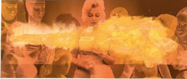
"Western Muses IV", gicleeprint en aquarel op papier, 230 x 113 cm