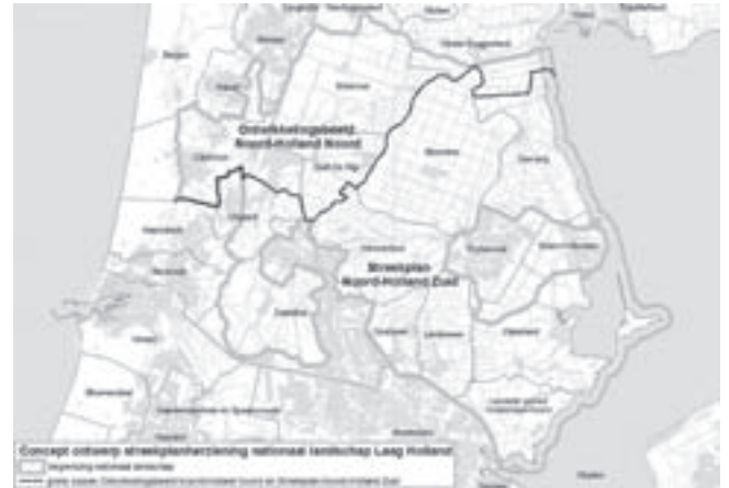
Laag Holland na 2006

Op de jaarlijkse braderie in Uitgeest was Acties-Uitgeest samen met onder andere Landschap Noord-Holland, Stichting de Hooge Weide en Stichting tot behoud van de natuurlijke en cultuurhistorische waarden in de Alkmaardermeeromgeving aanwezig. Er waren drie kramen met informatie over het landschap. Voor de bestuurders van deze stichtingen was de braderie een goede gelegenheid om persoonlijk kennis te maken met de vele steunbetuigers uit Uitgeest en om ze te bedanken. Het bestuur van Stichting de Hooge Weide zegt hierover: "Tijdens de braderie van zondag 24 augustus bleek opnieuw dat de bevolking van Uitgeest hecht aan zijn groene omgeving. Voor de mensen van stichting de Hooge Weide was dat opnieuw een enorme