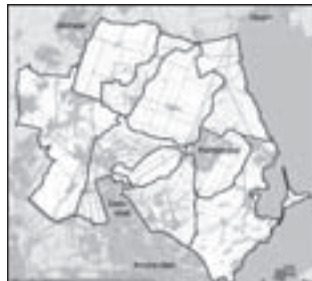
Laag Holland voor 2006

Uitgeest - Acties-Uitgeest vindt dat het gehele buitengebied van Uitgeest weer tot Laag Holland moet gaan behoren. Nationaal Landschap Laag Holland is een samenwerkingsverband van provincie, waterschap, gemeenten, natuurbeschermers en agrarische organisaties. De partijen hebben één gezamenlijk belang: duurzaam behoud van het landschap in Laag Holland. Nationaal Landschap Laag Holland zet zich in voor behoud en beheer van het landschap. Tot 2006 was geheel Uitgeest onderdeel van Laag Holland. In 2006 is op verzoek van de gemeente Uitgeest het Uitgeester gedeelte van de Castricumerpolder uit Laag Holland gehaald. Dit met het oog op bebouwing. Deze bouwplannen zijn momenteel van de baan. Een goede reden om de Castricumerpolder weer te laten aansluiten bij Laag Holland.