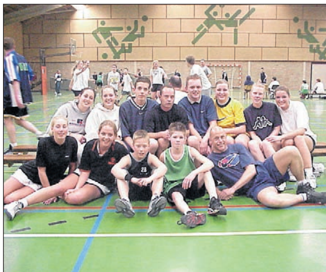
Teamfoto van het mixedtoernooi tijdens het 25-jarig jubileum