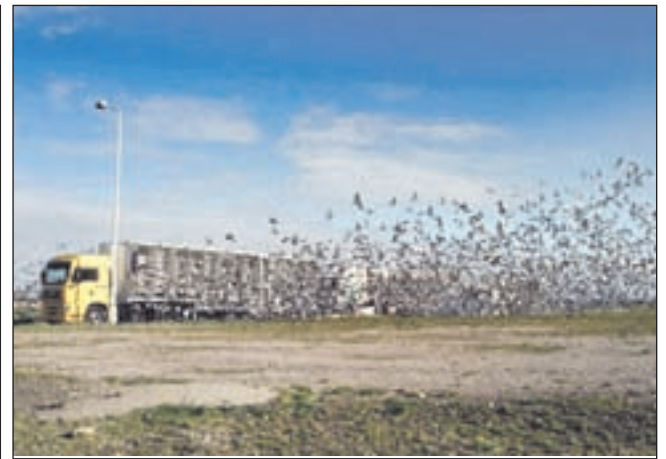
Lossing van de duiven na het transport.