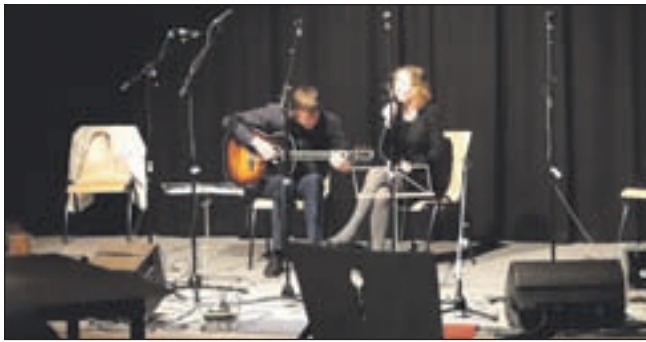
Het duo Linear dat 19 juni speelde op het podium