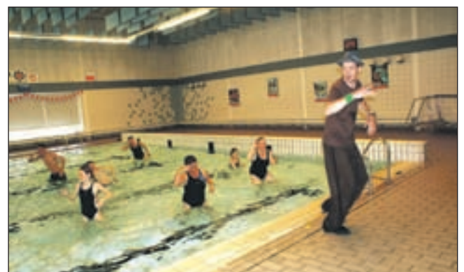
Wynzen geeft Lindyplons...

Castricum - Op zaterdag 23 augustus wordt er feest gevierd bij rugbyclub Cas RC vanwege het 40-jarig jubileum van de club. Er komen regionale dj's, zoals Ivory, Basterd en Pannafunk en een licht- en lasershow. Het feest is voor iedereen die van house, feesten en gezelligheid houdt. De minimum leeftijd is zestien jaar. Het feest wordt gehouden in een grote tent op sportpark Wouterland. Aanvang 21.00 uur, entree 5,00 euro.