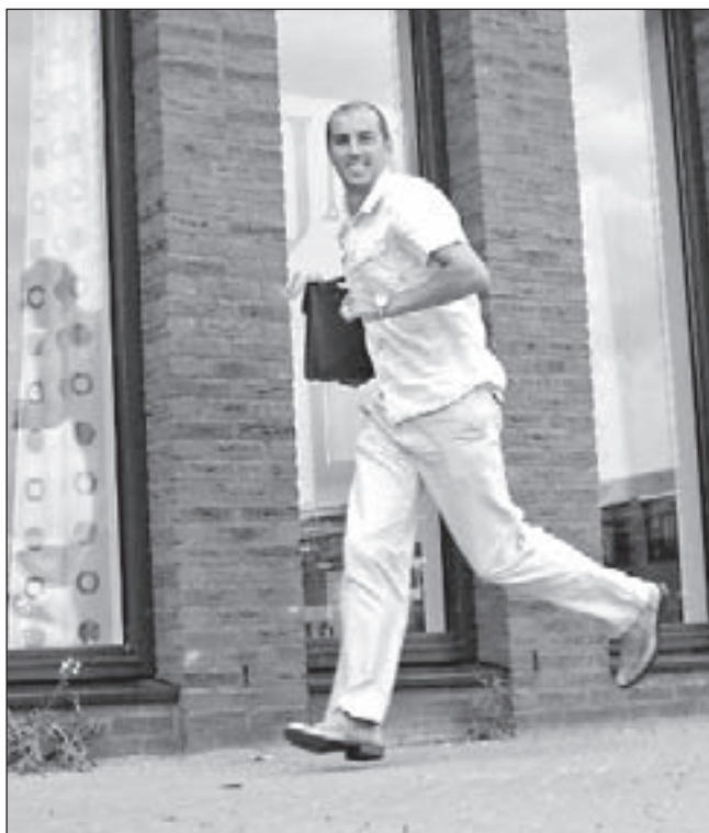
De persoonlijke en actieve werkwijze van JM Werkt scoort goed bij de klanten.