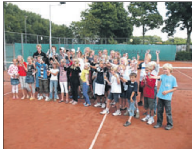
De trotse jeugdkampioenen van Tennisclub Bakkum kunnen terugzien op een sportieve en feestelijke week.

Al met al een geslaagde opening, die veel goeds belooft voor de overige festiviteiten, die in het kader van het kunstgrasveld gedurende een volle week door de Castricumse fusieclub worden georganiseerd.