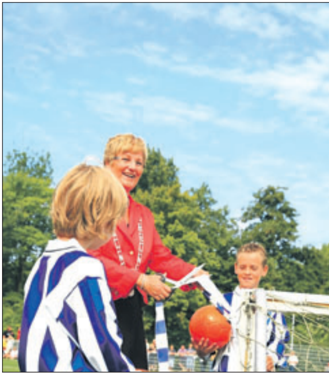
De burgemeester verricht de openingshandeling voor het kunstgrasveld van FC Castricum.