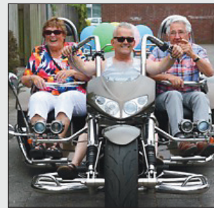
dochter. Na een buitje brak gelukkig het zonnetje door.

den. Totaal onverwachts. In het verleden hebben ze zelf ook motor gereden. Het werd een gezellig sportief uitje op Dorregeest aan het Uitgeestmeer. Het uitstapje werd verzorgd door Odisport en Buurman & Buurman. De twee dochters waren van de partij, de aanhang, de kleinkinderen en de achterklein-