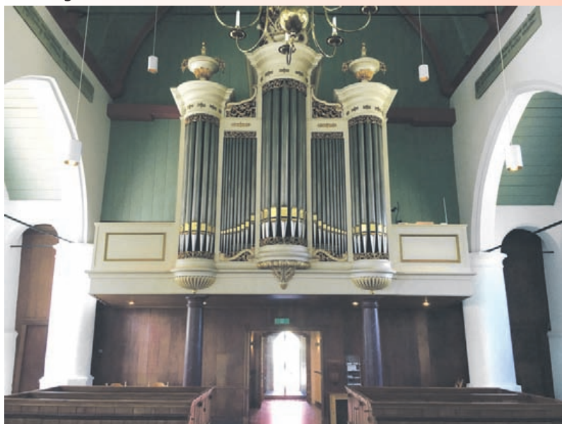
Het Flaes-orgel uit 1869, dat als laatste gehoord kan worden tijdens de orgeltocht.

Het volledige programma en alle praktische informatie is te vinden op www.orgeltochtenoord-holland.nl .