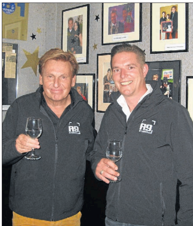
Henny Huisman en Ruud Stam proosten op de nieuwe samenwerking. Op de achtergrond een deel van de collectie foto's, die deel uitmaakt van het Henny Huisman Museum in A9Studios.

hebben we besloten om er een avondvullende show van te maken.” Huisman heeft de show inmiddels al in grote lijnen op papier staan: „Vanaf mijn tiende jaar tot aan nu, alles komt voorbij. Mijn eerste ontmoeting met Joop van den Ende, de kandidaten in mijn shows, die later beroemd werden, ik ga iemand in het publiek verrassen, het wordt een interactieve show.” Om die reden is ook niet gekozen voor de term dinnershow, maar: Henny Huisman Showbizz Dinnerparty. De show duurt vier uur en zal worden opgevoerd op 25 oktober, 15 november en 29 november. Op 25 december is er een aangepaste kersteditie. Kaarten kosten 75,- euro per persoon, inclusief driegangendiner, onbepreikt drinken uit de Nederlandse bar en gratis parkeren. Kinderen betalen 40,- euro. Ook bestaat de mogelijkheid om plaatsen aan de bar te reserveren voor 60,- euro per persoon, deze plaatsen worden uitsluitend per twee verkocht. Voor grotere groepen kunnen in overleg extra