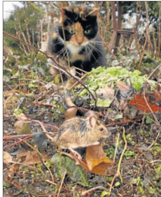
Het is nooit leuk als de kat een muis vangt. Maar voor de wetenschap is het nu nuttig.

Regio - Landschap Noord-Holland is momenteel bezig met een zoogdieratlas van Noord-Holland. Daar is straks in te lezen welke zoogdieren in Noord-