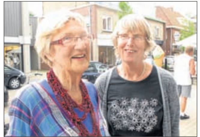
Tonna en Margriet voor Streetscape.

laat en moest in de remmen. Zij kon niet voorkomen dat zij met haar motor de motor van haar vriend aantikte. Hierdoor kwam zij ten val. De vrouw gaf aan pijn te hebben in buik en heup. Zij werd voor onderzoek overgebracht naar het ziekenhuis. Zij mocht na controle weer naar huis.