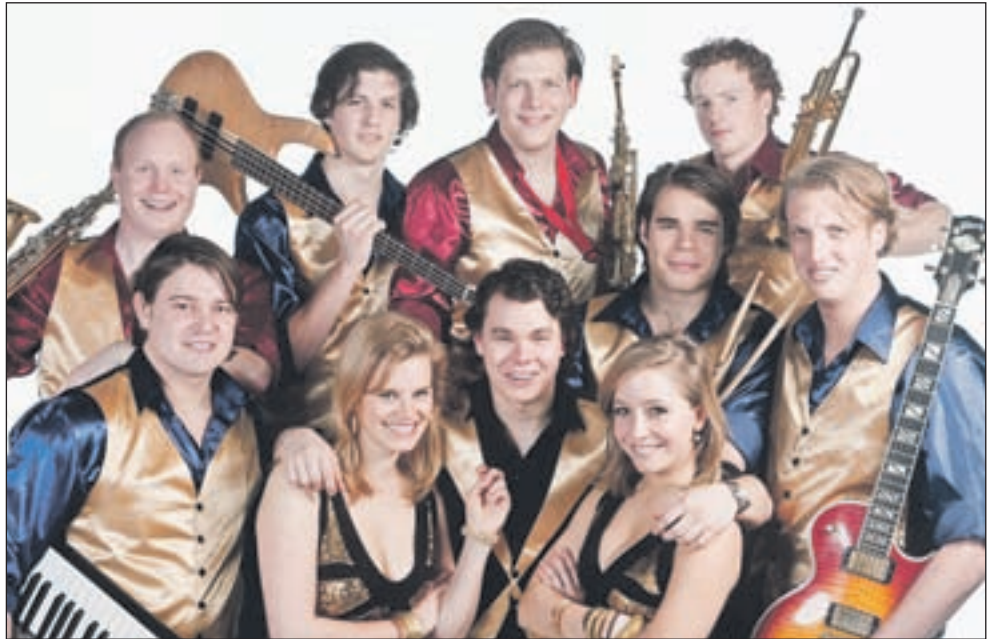
De Hermes House Band speelt zaterdag op de Breestraat.