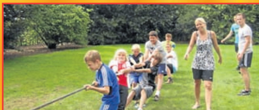
Team drie wint het onderdeel touwtrekken.