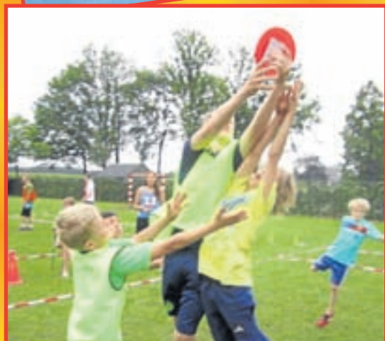
Actiefoto vliegende schotelspel.