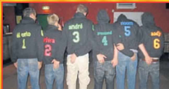
Alle captains van de zes team met persoonlijke sweater.