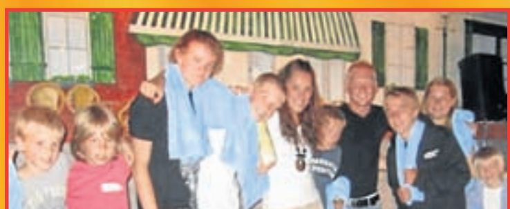
Team twee is de algehele winnaar van het zomerkamp.