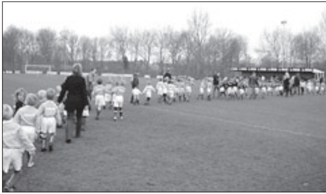
De mini's teams van FCCastricum betreden het hoofdveld om hun eigen WK op zondagmorgen te spelen. Er komen steeds meer jongere pupillen bij waardoor ook de toekomst van de club er rooskleurig uitziet.