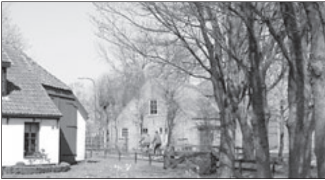
De Maer- of Korendijkroute gaat ook door de rustieke Breedeweg