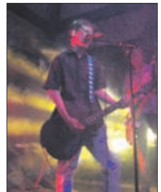
De winnaar van Discovery's bandbattle, Twice The Same op Discpop.

Castricum - In totaal stonden er bij 'The Bandbattle' in Discovery zeven lokale bands op het podium, die bijna honderd bezoekers naar het jongerencentrum trokken. De opening was om 18.30 uur door coverband The Garlicks, waarna de formaties Jude, The Lost Noise, Twice The Same, Mentally Retarded Friend en Translated de strijd met elkaar aangingen. De deelnemende bands bestonden allemaal uit jonge muzikanten met iets meer en wat minder ervaring. Voor The Lost Noise bijvoorbeeld was dit pas hun tweede optreden. Twice The Same kreeg de meeste van de zeventig uitgebrachte publieksstemmen en kreeg ook de voorkeursstem van de Discovery jury. De jury was vooral te spreken over de presentatie van de driemansformatie, waar de energie van af spatte. Twice The Same won de wedstrijd overigens maar nipt, ze werden nauw gevolgd door Jude, die ook een prima optreden neerzette. De winnaar kreeg een cadeaubon te