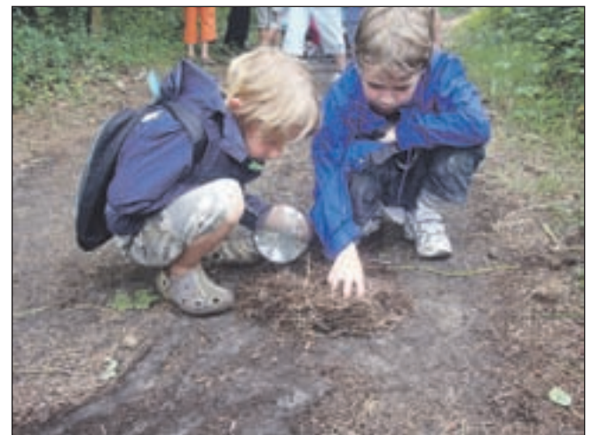
Onderzoeken tijdens de Rangercursus.