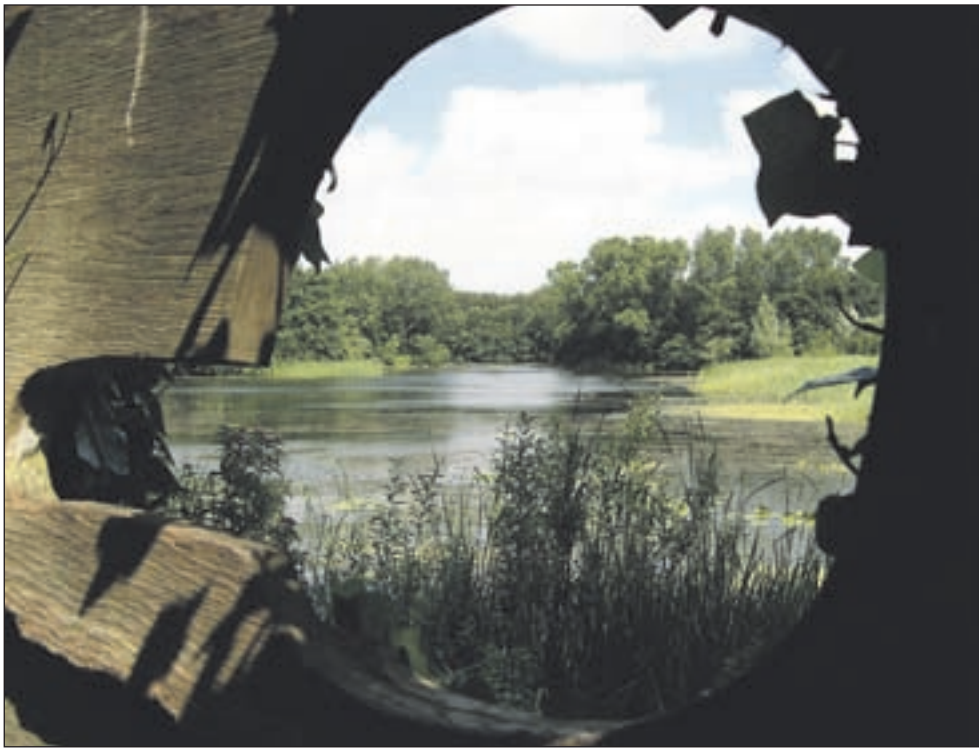
Het 'Meertje van Vogelenzang' in de duinen bij Bakkum.