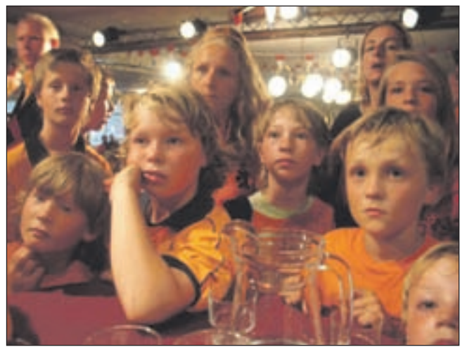
Jonge voetballertjes bleven maar staren naar die grote held, die zij zo bewonderen.

De eerste spreker tijdens de officiële huldiging was wethouder Christel Portegies. "Wat hebben we genoten van het WK, van het Nederlands team en van jou", zo begon zij. "Vier weken lang hebben we met zijn allen aan de buis gekluisterd gezeten. En ondertussen zagen we het aantal ploegen langzaam slinken. Om de beurt vielen Denemarken, Japan, Kameroen, Slowakije, Brazilië en Uruguay. En toen kwam Spanje. De finale. Een bloedstollend gevecht met wat ons allemaal betreft de geheel verkeerde winnaar." Het deed zeer. Maar