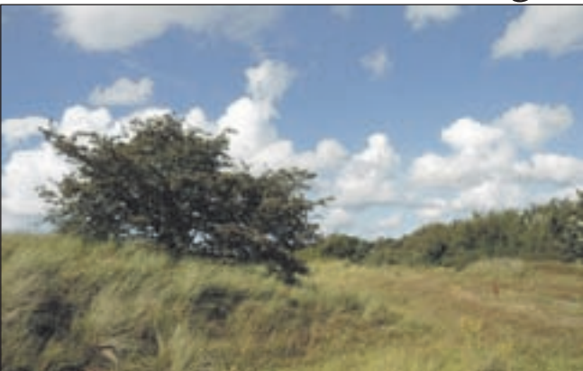
De nieuwe IVN-natuurwandeling voert onder meer over de Westert.