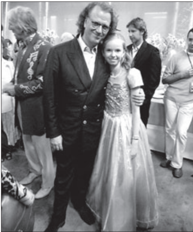
Melissa met André Rieu in de ArenA te Amsterdam.