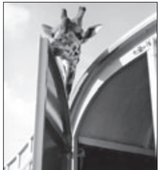
De trots van het circus: giraffe Kenay.

Bakkum - Circus Belly Wien presenteert van 6 tot en met 10 augustus een vernieuwd ruim 2,5 uur durend klassiek circusprogramma te Bakkum bij de Kennemerduincamping op de Zeeweg.