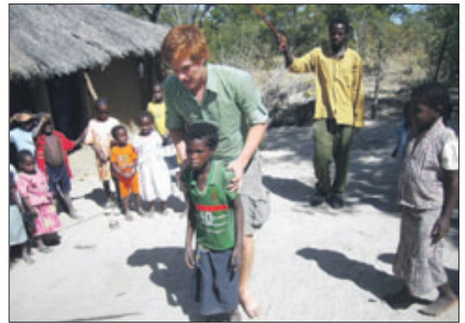
Kleuters en peuters leren touwtje springen.