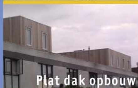
Plat dak opbouw