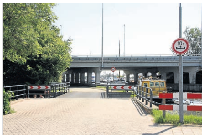
Deze brug in de Populierenlaan mag alleen nog worden bereden door voertuigen die lichter zijn dan tien ton (10.000 kilo)

De toezegging om eind dit jaar de verkeersafwikkeling van de HMS te evalueren alvorens een definitief verkeersbesluit rond de HMS als geheel te nemen blijft uiteraard van kracht.