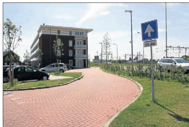
Voor De Melksuiker geldt in het vervolg eenrichtingsverkeer

Het Fort bij Veldhuis is onderdeel van de Stelling van Amsterdam. Het Fort is gelegen aan de Genieweg 1 in Heemskerk. De ligging van het fort is op de grens van Heemskerk en Zaanstad. Toegang: Volwassenen 3,50, kinderen van 8 tot 12 jaar, 2,50, kinderen jonger dan 8 jaar gratis en houders van een veteranenpas gratis. Openingstijden: 10.00 - 17.00 uur. Zie ook: www.arg1940-1945.nl.