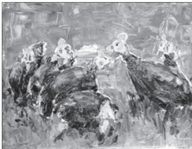
Expositie Hans Goedhart

de bedoeling dat de Rode Halve Maanvereniging in Naryn in de toekomst financieel onafhankelijk kan functioneren. Hoe men daarvoor fondsen kan werven willen de jongeren, die van 5 tot 19 juli ons land bezoeken, hier van het Nederlandse Rode Kruis leren. Het Rode Kruis wil laten zien dat er met de verkoop van tweedehands artikelen en giften van ondernemers geld ingezameld kan worden. Daarvoor hebben zij op 11 juli een kraam op de braderie op camping Bakkum gehuurd. Naast de verkoop van diverse artikelen kan men ook een gokje wagen bij de levende fruitmachine, het krasvel of voor de kinderen de grabbelton. En dit alles voor het goede doel! Er is ook foto- en informatiemateriaal over Kyrgyzstan en belangstellenden kunnen er kennis maken met de gasten. De braderie is op vrijdag 11 juli tussen 11.00 en 17.00 uur op camping Bakkum, Zeeweg 13.