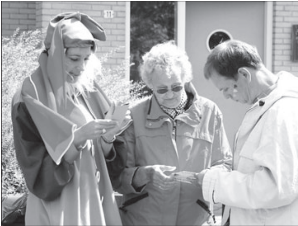
Het Stratenfeest van Harteheem