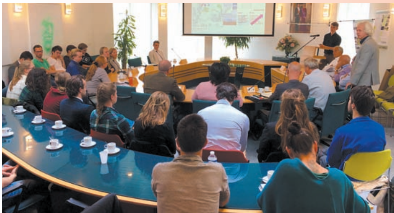
Vier verschillende projectgroepen presenteerden hun bevindingen afgelopen vrijdag.