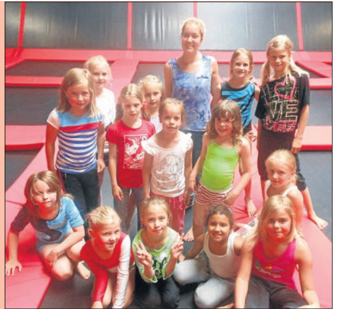
De jong talent-groep van dinsdag- en vrijdagmiddag