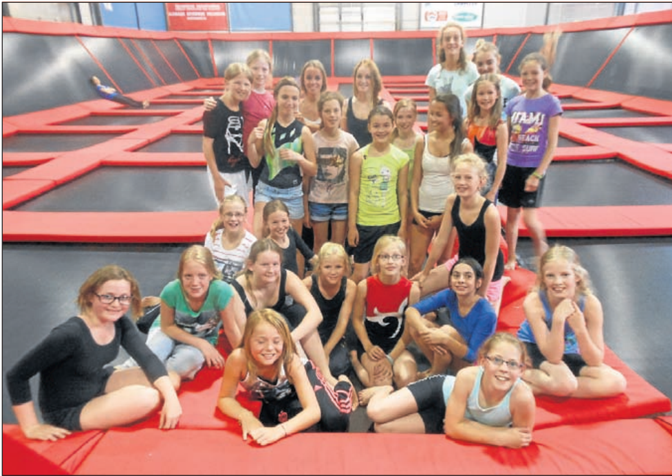
De recreatiegroepen van van de vrijdagmiddag