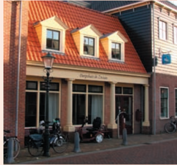
In Dorpshuis de Zwaan is donderdagavond 6 juli een openbare inloopavond over het Centrumgebied

De afgelopen drie maanden is door een projectteam met omwonenden en belanghebbende partijen gewerkt aan een voorstel voor een beeldkwaliteitsplan voor het centrumgebied van Uitgeest. Het resultaat van dit werk wordt tijdens de openbare avond in Dorpshuis de Zwaan gepresenteerd en toegelicht door enkele deelnemers aan de werksessies. Alle belangstellenden zijn van harte welkom.