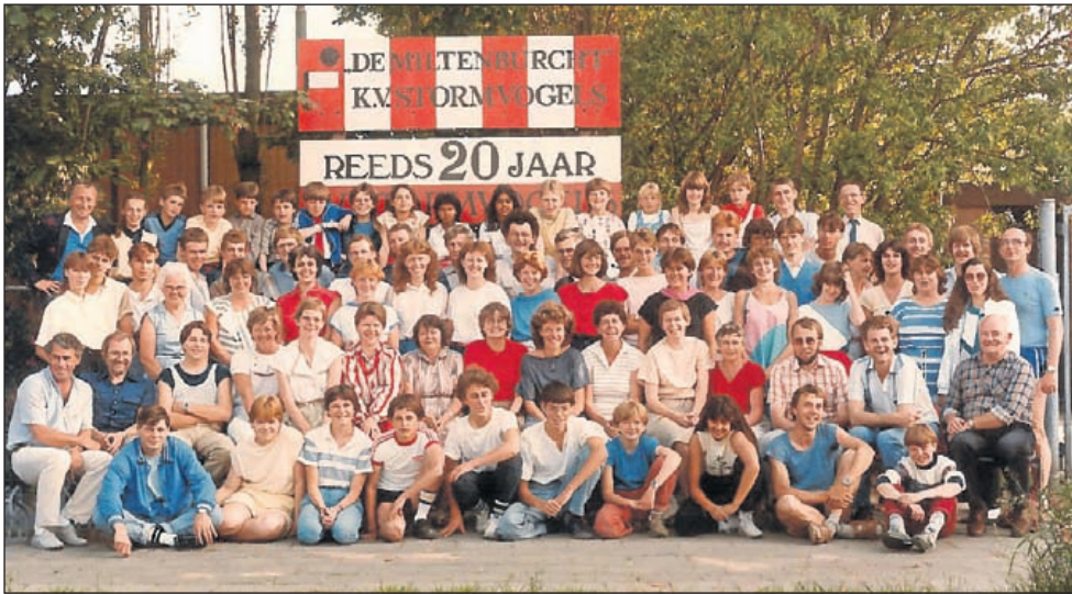
De leden bij het 20-jarig bestaan in 1984