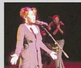
Jos Apeldoorn, beelden Esther Leijen, schilderijen

ZONDAG 29 JUNI, AANVANG 15 UUR: Joke Schilling zingt en vertelt Muzikale ondersteuning: Kees van den Engel