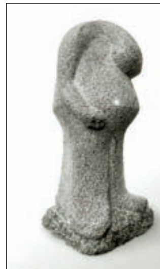
Obesitas, een beeld van Ans van Straaten

Akersloot - De tot nog toe druk bezochte beelden- en schildertentoonstelling van Ans van