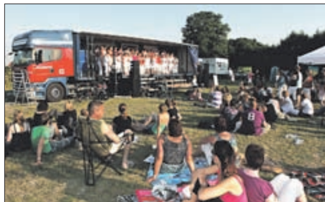
Bezoekers luisteren naar een optreden van Surprising.

Naast de sportieve hoogtepunten is er rond het parcours genoeg te beleven. Een gezellig terras, muziek en diverse activiteiten voor alle leeftijden. Inschrijven voor de twaalfde Skeelerronde van Uitgeest kan ter plekke in sporthal De Wissel. De organisatie hoopt wederom veel enthousiaste deelnemers te mogen begroeten.