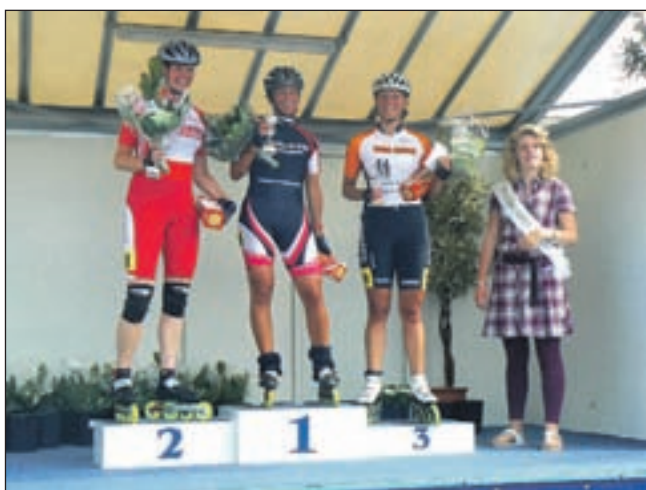
Winnaars van de Skeelerronde 2009.

Uitgeest - De temperaturen stijgen en daarmee is het zo langzamerhand goed weer geworden om een rondje te skeeleren in de prachtige omgeving van Uitgeest en omstreken. Terwijl men geniet, is de organisatie van de Skeelerronde van Uitgeest alvast druk doende met de voorbereidingen op de twaalfde Skeelerronde van Uitgeest die dit jaar plaatsvindt op zondag 15 augustus.