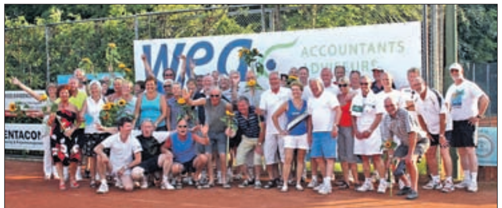
De traditionele groepsfoto van de prijswinnaars van het Wea-toernooi.

Inschrijven kan tussen 10.00 en 12.00 uur in café 't Voorom, Kerklaan 20 in Akersloot. De route is via de GPS of de routerol voor iedereen verkrijgbaar. Als er vraag naar is wordt bekeken of er een voorrijder komt. Voor meer info zie www.amcbacchus.nl .