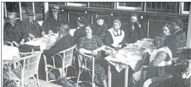
Koffiestop onderweg De ouden van dagen met hun begeleiders in een draaimolen