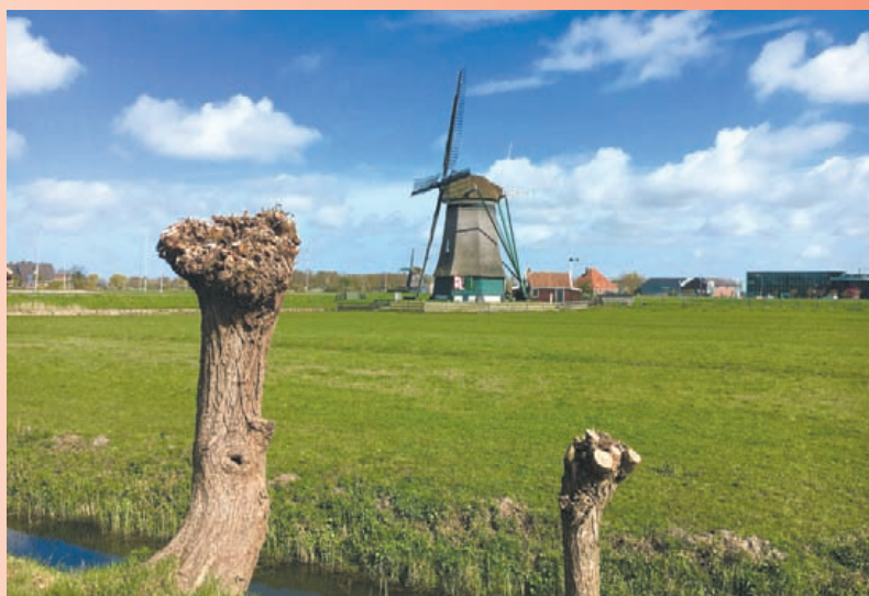
De Kat, een van de molens die aankomend jaar subsidie ontvangt van de gemeente.

De molens waarvoor de subsidie geldt zijn De Kat, De Dog, De Tweede Broekermolen en de Dorregeestermolen. De subsidieverordening en andere besluiten die tijdens de raadsvergadering zijn genomen, zijn terug te vinden op www.officielebekendmakingen.nl .