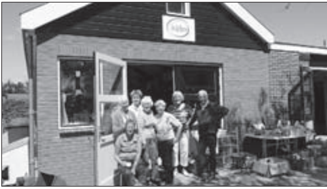
Enkele vrijwilligers.