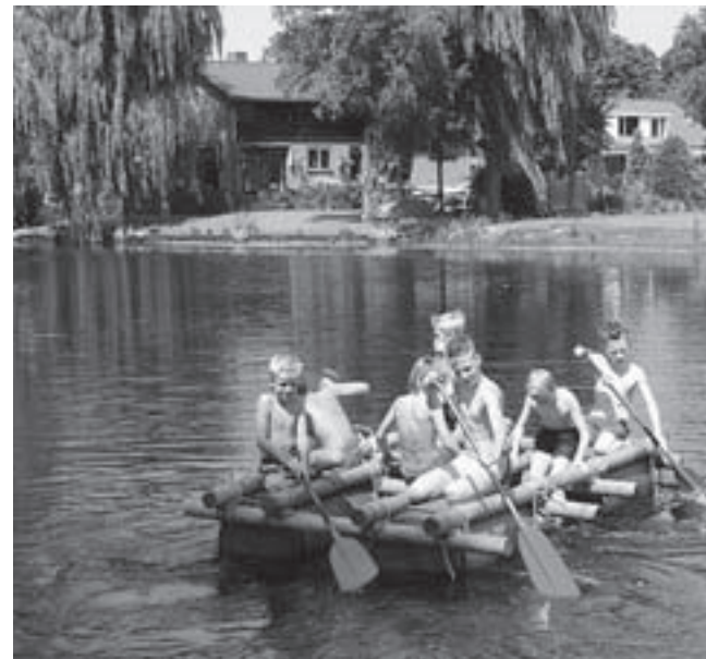
Vloten bouwen is één van de activiteiten bij de Jeugdvakantiecocktail.

Castricum - Op maandag 21 juni gaat de inschrijving van start voor de Jeugdvakantiecocktail georganiseerd door de Stichting Welzijn Castricum.