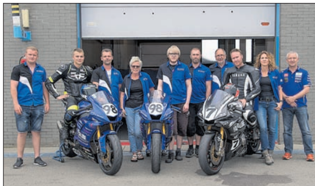
Het racingteam Edwin Ott Motoren

Uitgeest/Akersloot - De dienst van de Protestantse gemeente Uitgeest-Akersloot vindt zondag 11 juni plaats in de kerk op de Castricumweg in Uitgeest, aanvang 10.00 uur. Voorganger is de heer B. Appers.