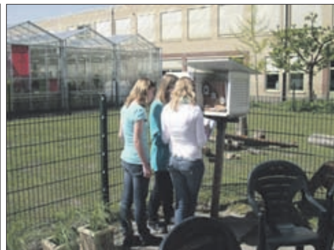
Leerlingen verrichten dagelijks weermetingen op het terrein van het Clusius College Castricum.

schapsmuseum van Europa. Het team met het meest innovatieve idee wint de originaliteitsprijs en brengt een bezoek aan het Museum Jean Tinguely in Zwitserland, waar van schroot vervaardigde installaties met bewegende onderdelen tentoongesteld zijn. Omdat de Shell Young Technical Award dit jaar haar vijfjarig jubileum viert, staat de genomineerden op 23 juni een spectaculaire act te wachten. Een derde winnaar wordt gekozen door het publiek. Via www.shellyoungtechnicalaward.nl en www.sevendays.nl kan gestemd worden op de genomineerden. Onder de stemmers worden tien proefabbonementen van 7Days en vier vrijkaarten voor science center NEMO verloot. De wedstrijd is een samenwerking tussen Shell Nederland en science center NEMO, waarbij leerlingen uit de onderbouw van het voortgezet onderwijs worden uitgedaagd uit oude apparaten een bewegend, technisch kunstwerk te maken.