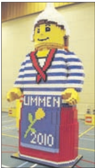
Het 364.8 cm hoge meisje Limbonita gemaakt door basisschoolleerlingen.

Met al die Legosteentjes en het prachtige uitgebreide promotiemateriaal (ridders, basketballers, apen, een krokodil en ce-