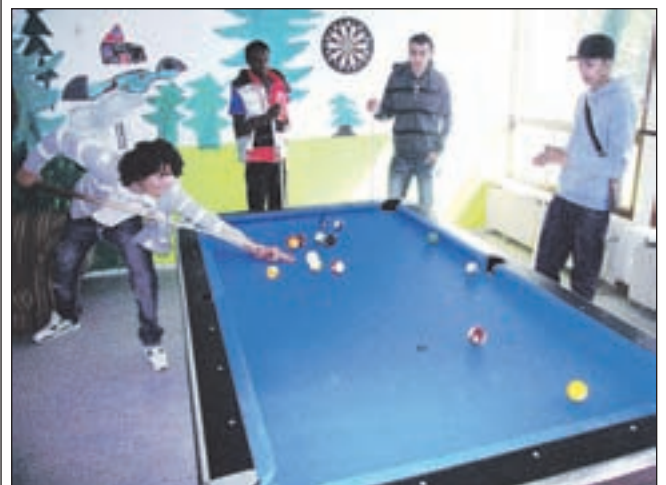
Jongeren nemen het poolbiljart in gebruik.

Akersloot had in het verleden bijna tweewekelijks een leuk evenement om naar uit te kijken, het initiatief van het Korenfestival is dan ook met open armen ontvangen. De beide ondernemers zijn dan ook sponsor van deze dag. Voor het volledige programma zie www.hoorntje.nl/korenfestival .