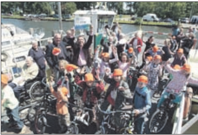
Schoolkinderen en bestuurders vieren de eerste vaart.