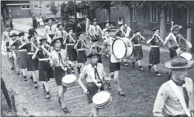
Tamboerkorps ZOSNO uit 1957