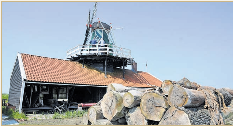
Een loods en de lattenzager op het inmiddels sterk verpauperde erfgoedpark

Stichting Cornelis Corneliszoon gooit het bijtje er bij neer