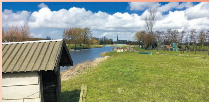
De Terp is vanaf de brug over de Westgeestervaart losloopgebied.

maandag 6 juni woensdag 8 juni donderdag 9 juni vrijdag 10 juni