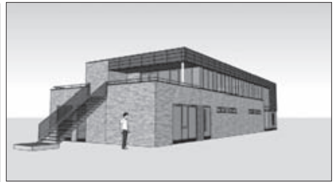
Impressie van het nieuwe onderkomen van MHCC. Volgens de planning zal het in het voorjaar van 2011 gereed zijn.

Voor meer informatie over MX Team Akersloot kijk op www.mx-teamakersloot.nl .