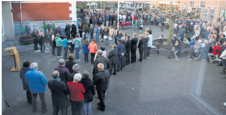
Overzicht van de herdenking bij het gemeentehuis van vorig jaar (foto: gemeente Uitgeest).