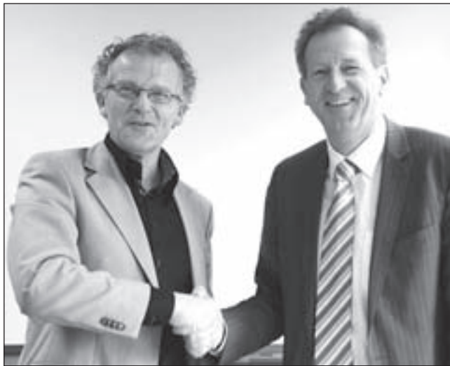
De heren Tromp van Kennemer Wonen (links) en Van Ruth van ViVa! Zorggroep schudden elkaar de hand na ondertekening van de contracten.

bestaande bebouwing. Daarna maakt het oude gebouw plaats voor het tweede deel van de nieuwbouw. Hierdoor kunnen bewoners van de oude De Boogaert met elkaar blijven wonen in de vertrouwde omgeving en is verhuizen naar een ander woonzorgcentrum niet nodig. Eigenaar van het nieuwe woonzorgcentrum en opdrachtgever van de bouw is woningcorporatie Kennemer Wonen. De appartementen worden gebruikt door ViVa! Zorggroep, Stichting Odion en huurders van Kennemer Wonen.