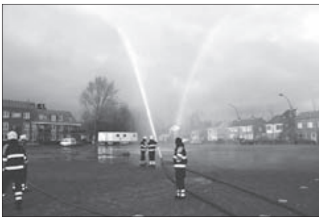
Demonstratie tijdens de open dag.