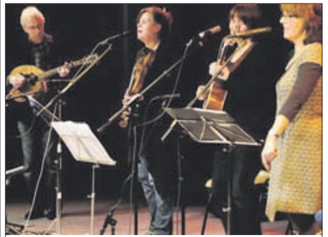
Folkgroep Amhrán, zij speelden op het vorige open podium.

Waterskisschool Waterfun geeft een show weg bij het Schippersrijk vanaf 13.00 uur. Jacques Fontijn skiet op blote voeten als het water vlak is. Dit gaat met een snelheid van zo'n 68 kilometer per uur. Rens Cosijn, atleet van Go Fast, geeft een wervelende wakeboardshow. Ook de Brandweer van Uitgeest ontbreekt niet. Deze geeft spectaculaire demonstraties vanaf 14.30 uur. Een grote zeemansmarkt op het terrein naast de watersportwinkel maakt de open watersportdag compleet.