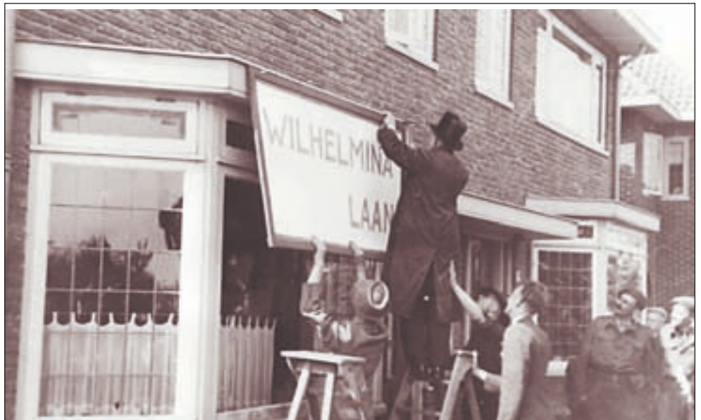
De Wilhelminalaan maakt zich op om de bevrijding te vieren.