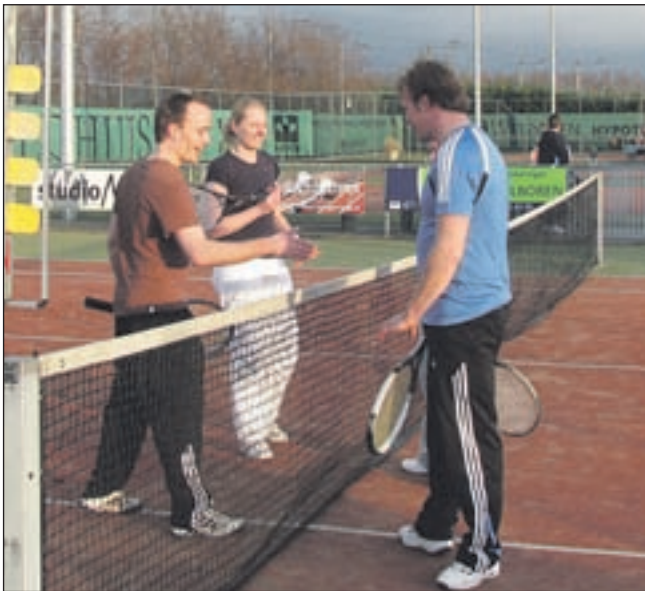
De deelnemers schudden elkaar de hand na de eerste wedstrijd in het avondzonnetje.