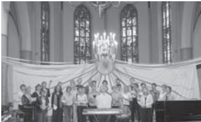
Optreden van het Aquariuskoor tijdens een korenfestival in Castricum.

Voor de pauze bijt het B-orkest de spits af onder leiding van Guus Hendriks. Met ondersteuning van gevorderde accordeonisten laten zij horen wat zij zoal het afgelopen jaar bereikt hebben. Want ook voor startende accordeonisten is er ruimte bij de BCAC. Daarna is het de beurt aan een accordeonensemble. Ook dit ensemble neemt deel aan het festival in Innsbruck. Kaarten: 8,00 euro, 65+ 7,00 euro, kinderen tot 12 jaar 5,00 euro. Meer informatie: www.accordeonvereniging-bcac.nl .