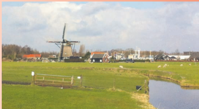
Het gebied tussen het Huttenweckerrein en molen De Dog is een van de twee locaties die wordt onderzocht op geschiktheid om de ijsbaan heen te verplaatsen.

De vergadering van de Commissie Algemene Zaken en Financiën van donderdag 16 maart 2017 gaat niet door. Het enige agendapunt (De controleverordening) schuift door naar de commissievergadering van 6 april 2017. Informatie over de volledige agenda's is te vinden op het Raadsinformatiesysteem via de homepage van www.uitgeest.nl