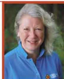
MOLENWEIDE 38 1902 CH CASTRICUM 06 29 43 72 24