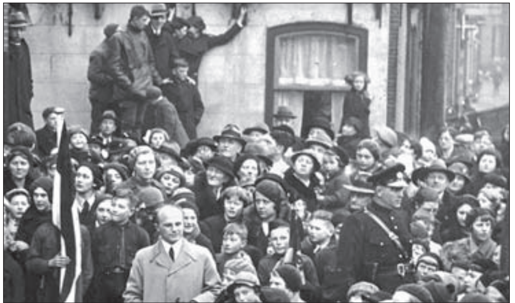
Ook in Castricum werd de bevrijding massaal gevierd.