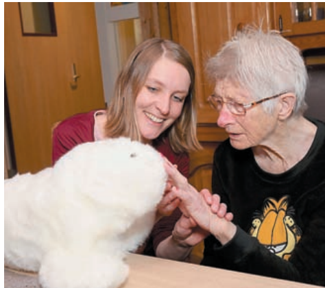
Knuffelrobot helpt in de zorg bij Stichting Reigershoeve.

Als Rabobank IJmond willen wij graag de werk- en leefomgeving van mensen in de IJmond versterken. Dit doen we door kennis te delen, partijen aan elkaar te verbinden en door geld beschikbaar te stellen. Vanuit de winst stelt de bank jaarlijks een bedrag beschikbaar ter ondersteuning van initiatieven die bijdragen aan versterking van de IJmond. Dit geld wordt uitgekeerd via onze coöperatiefondsen.