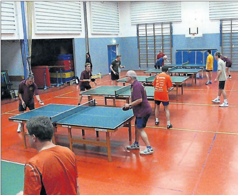
De vloer van de zaal waar TTVU speelt is inmiddels vernieuwd