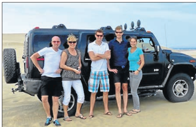
Manon met familie

Kent u een Uitgeester die de grote stap naar het buitenland heeft gewaagd en zijn of haar verhaal wil vertellen aan de inwoners van Uitgeest? Laat het ons weten via kantoor@uitgeestercourant.nl .