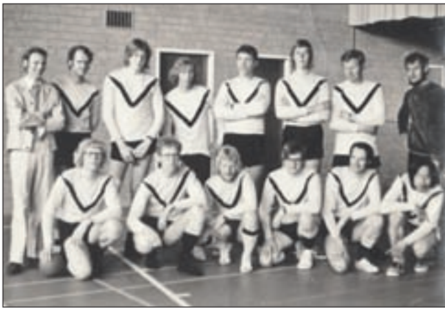
Kampioen tweede klasse afdeling Alkmaar '70-'71.