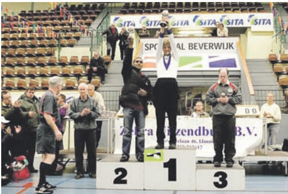
De winnaars van 2008.